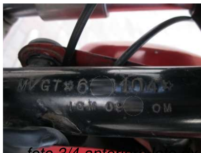
foto 3/4 anteriore lato dx foto 3/4 posteriore lato sx foto punzonatura n. telaio foto numero motore (cifre